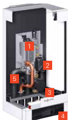
VITOCAL 200-A vnitřní jednotka