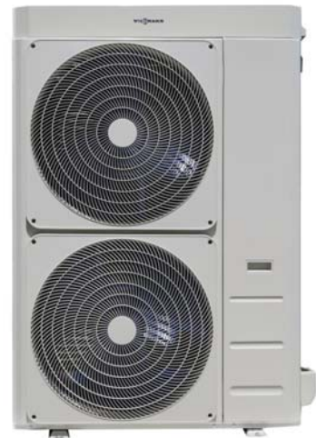
Vitocal 100-A 14 až 18 kW

Nová tepelná čerpadla vzduch/voda Vitocal 100-A pokrývají většinu požadavků u novostavby i při modernizaci. S výkony mezi 6 a 18 kW zaručují tato zařízení komfortní dodávky tepla a přípravu teplé vody.