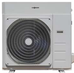
Vitocal 100-A 10 kW