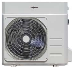
Vitocal 100-A 6 a 8 kW

Tepelné čerpadlo vzduch/voda: maximální účinnost při minimální spotřebě energie.